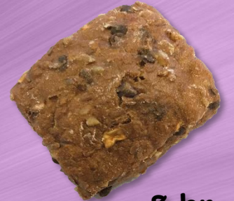
Rugbrød m/ chokolade