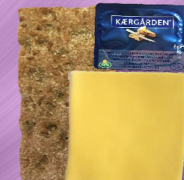
Knækbrød m/ smør & ost