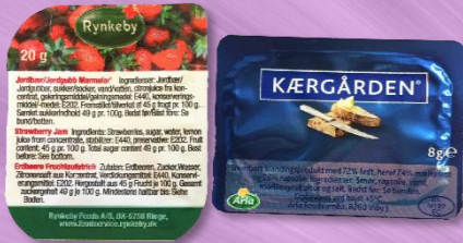
Smør eller marmelade