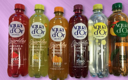
Vand m/ smag