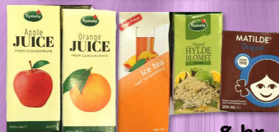
Lille juice, icetea, hyldeblomst eller Mathilde kakao